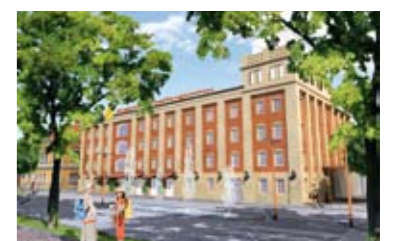
Umbaubeginn des Jugend- u. Familiengästehauses