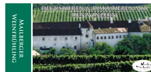
Weinfrühling in Mailberg

Top-Weine der Region können ein Wochenende lang verkostet werden.