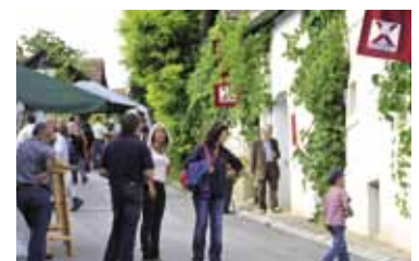
Kunst & Wein in Haugsdorf Seite 5 20./21. August 2011