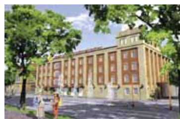
JUFA Gästehaus Eselmühle Seite 7 öffnet seine Pforten