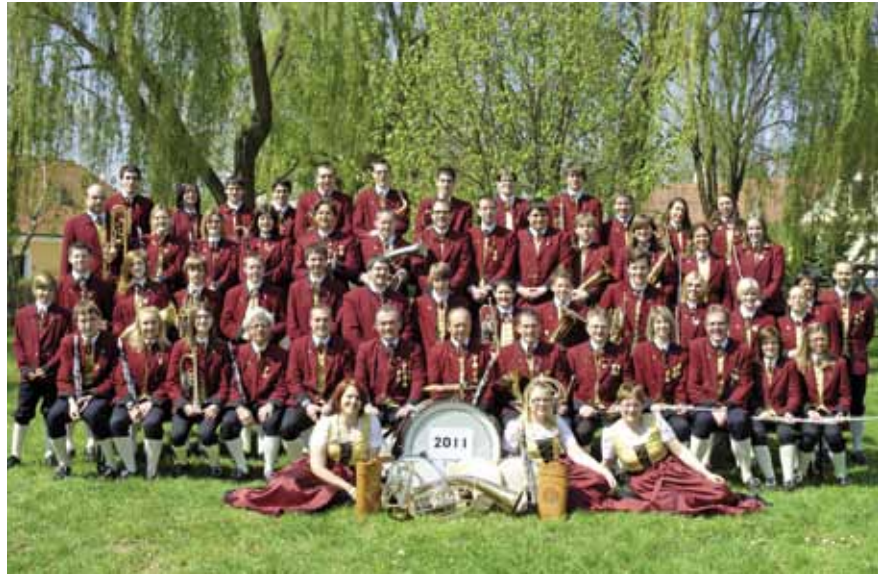
Dorfmusik Hadres im Pulkautal