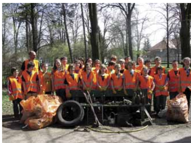
Aufsatz im Rahmen der Aktion Frühjahrsputz – NÖ Abfallverband - der beiden ersten Klassen der Hauptschule Haugsdorf im Kaiserpark in Haugsdorf