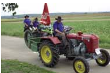
5. Traktorkirtag in Alberndorf Seite 6 6./7. August 2011