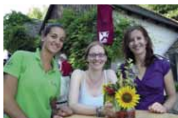
Kunst & Wein in Haugsdorf 25 und 26. August