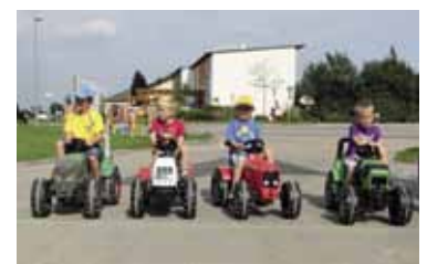
Traktorkirtag in Alberndorf 11. und 12. August