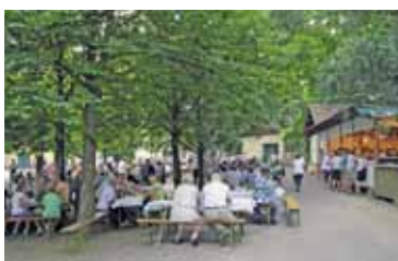
Peregrinifest in Peigarten 7. und 8. Juli