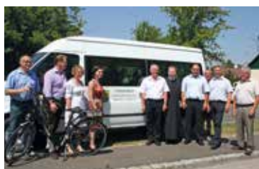
Energiekirtag im Pulkautal

Am 7. und 8. September 2013 feiert die Marktgemeinde Hadres die 50jährige Wiederkehr der Erhebung zur Marktgemeinde