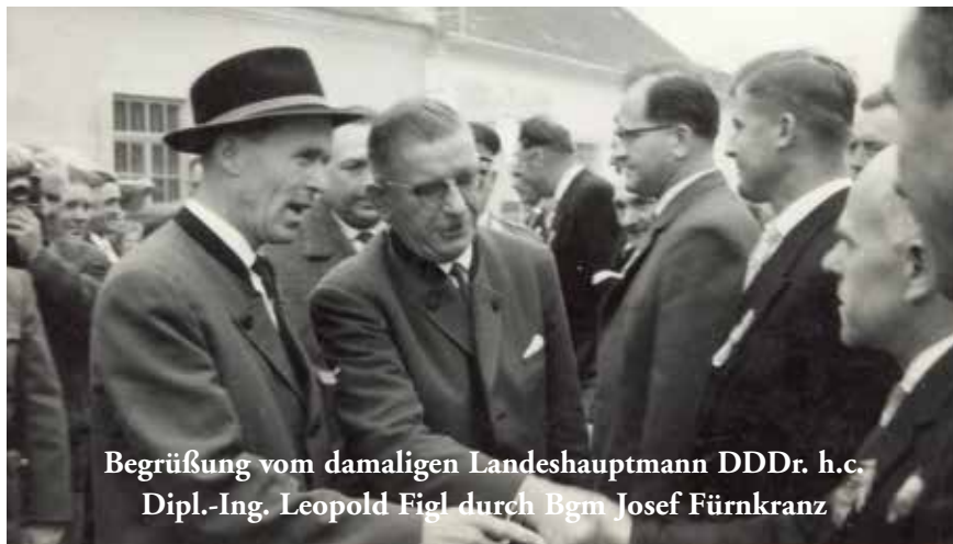
Begrüßung vom damaligen Landeshauptmann DDDr. h.c. Dipl.-Ing. Leopold Figl durch Bgm Josef Fürnkranz

Am 7. und 8. September 2013 feiert die Marktgemeinde Hadres die 50jährige Wiederkehr der Markterhebung. Eingeleitet wird diese Feier am Samstag um 14.00 Uhr mit der Einweihung des Kreuzes in Untermarkersdorf vor dem Friedhof,