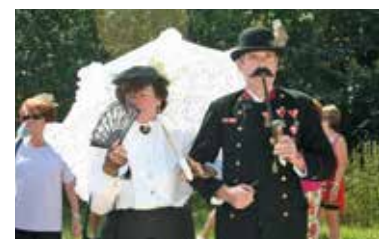
Kirtag anno 1910 in Seefeld-Kadolz