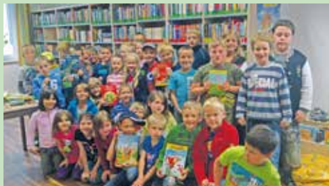
Schüler der VS Haugsdorf

Bücherei Haugsdorf Gemeindehaus Haugsdorf, Laaer Straße 12, 1. Stock (Aufzug vorhanden), Mittwoch, 9.00 bis 10.00 Uhr, Freitag, 17.00 bis 18.30 Uhr