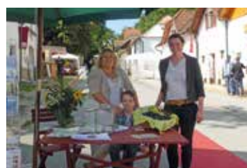
Kunst & Wein in Haugsdorf