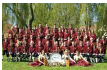
30 Jahre Dorfmusik Hadres

Die Schlussveranstaltung mit Preisverleihung findet ab 16 Uhr bei der FF Mailberg statt.