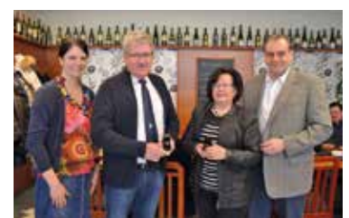
Goldene Ehrenringe an Alberndorf