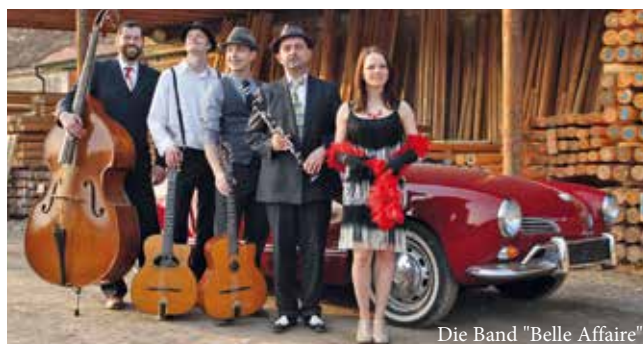
Die Band "Belle Affaire"

Weingut Michael Sailer, 2054 Auggenthal 0650/2732400 – www.weingut-sailer.at